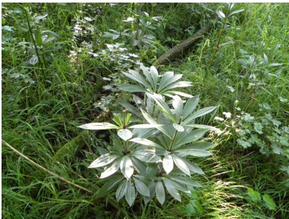
Im Rahmen des BioWild-Projekts wird neben dem Verbiss der holzigen Vegetation insbesondere auch das Vorkommen von seltenen krautigen Pflanzenarten erfasst.

Hier: Eine durch Schalenwild verbissene Türkenbundlilie.