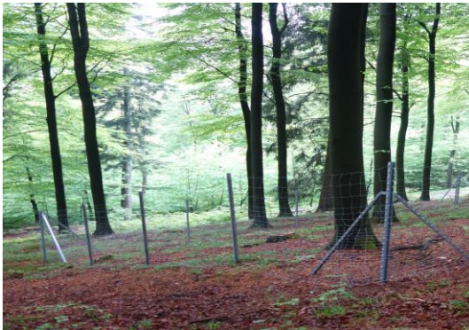
Ein BioWild-Weisergatter kurz nach der Fertigstellung in einem Buchenaltbestand mit vereinzelter Weißtannen- und Fichtenbeimischung und...