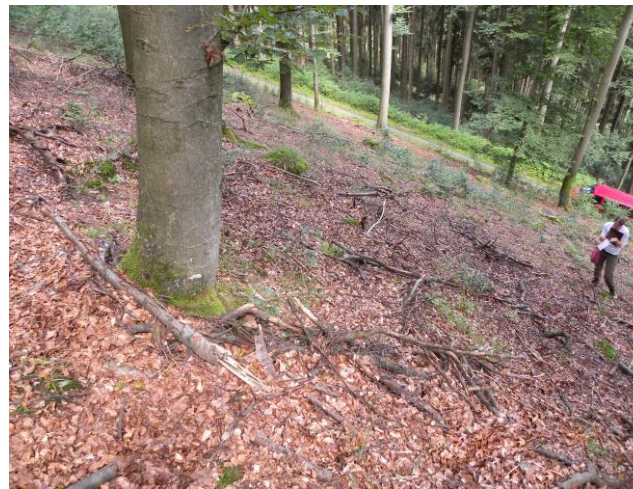
Oft befinden sich mehr Gehölze und krautige Pflanzenarten auf den Versuchsflächen als auf den ersten Blick zu vermuten wäre.