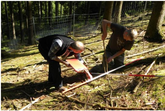
Auf einer der 496 Versuchsflächen erheben Mitarbeiter der Universität Göttingen die Gehölzverjüngung.