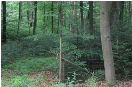
...ein vor ca. 15 Jahren in einem vergleichbaren Bestand angelegtes Weisergatter mit reicher Weißtannen- und Buchennaturverjüngung. Außerhalb ergibt sich auf Grund des Wildverbisses ein anderes Bild.