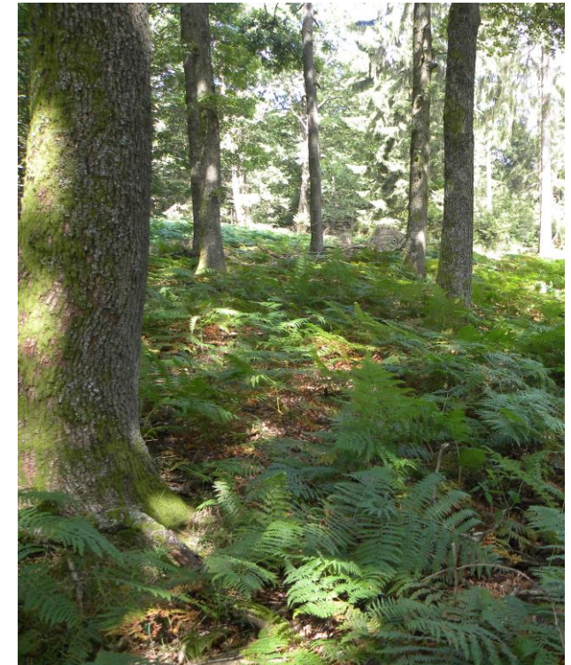
Eichennaturverjüngung oder Adlerfarn? Die Zukunft wird es zeigen.